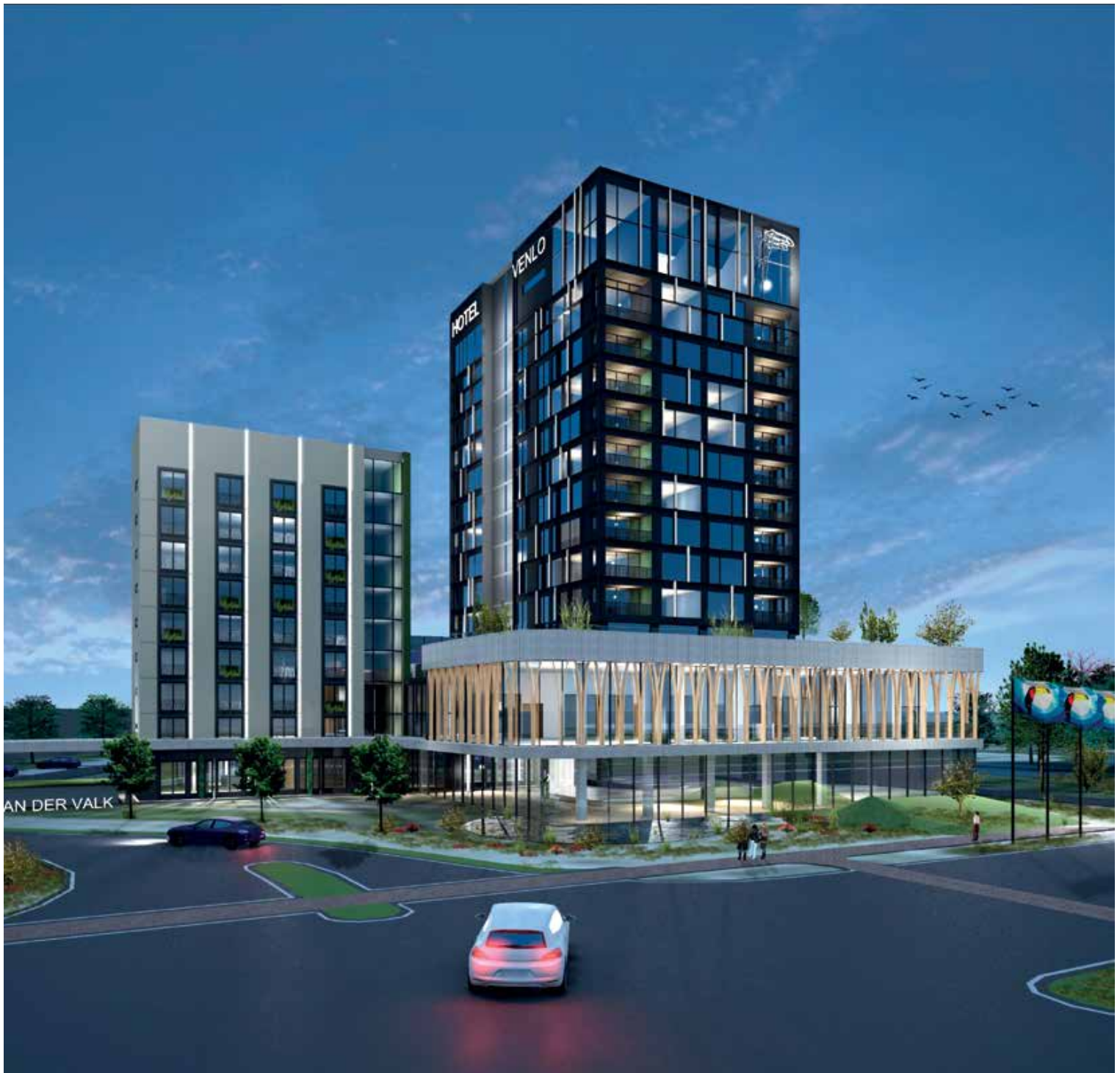
Het nieuwe hotel van Van der Valk in Venlo wordt zoveel mogelijk C2C (foto: Quant Architectuur).