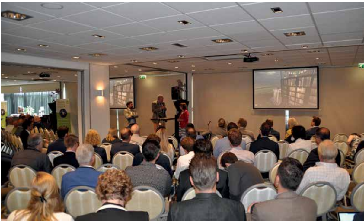
Een innovatieworkshop maakte duidelijk dat investeerders en beheerders niet meer om het concept ‘gezonde omgeving’ heen kunnen.

Het onderzoek krijgt nog een vervolg, maar de bewijslast voor de meerwaarde van een gezond gebouw is nu al